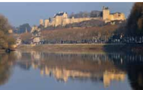
Site de la Vienne à Chinon