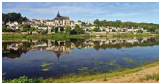
Berges de Vienne et vue sur Candès-Saint-Martin

Bivouac : campement provisoire et léger, d'une nuit maximum, du coucher au lever du soleil.