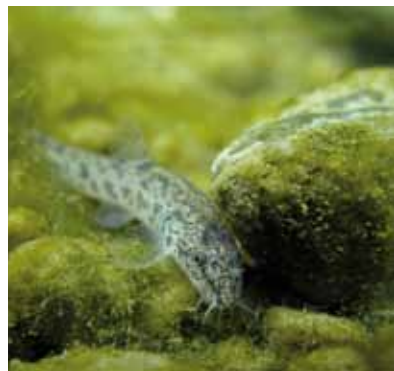
Loche de rivière

Pour la clientèle touristique, des formules souples sont proposées : carte vacances, carte journalière. Se renseigner auprès des Fédérations de Pêche, des offices de tourisme et de la Maison du Parc.