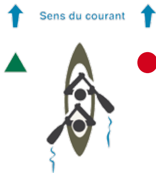
Balisage du chenal de navigation