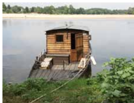
Toue sur la Vienne

Pour passer l'examen, il faut s'inscrire dans un bateau-école agréé. En Indre-et-Loire, deux bateaux-écoles sont agréés à Tours. En Maine-et-Loire, on en compte huit : Angers, Avrillé, Champigné, Cholet, Saumur, Saint-Florent-le-Vieil, Saint-Jean-de-Linières et Sainte-Gemmes-sur-Loire.