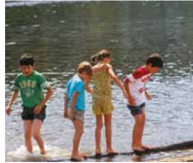
Jeux d'eau en Vienne

Dans d'autres lieux, la baignade n'est pas interdite mais est sous l'entière responsabilité du baigneur.