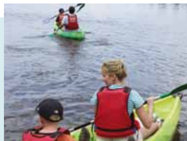
Canoës sur la Loire