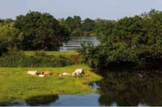
Pâturages en bord de rivière (domaine privé)