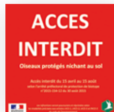
Exemples de signalétique APB sur la Loire

Les oiseaux ne sont pas les seules espèces à protéger. La Grande muette, moule perlière d'eau douce vivant sur les fonds graveleux de la Vienne est particulièrement menacée. Afin de favoriser sa sauvegarde, certaines activités ayant un impact sur le fond du lit peuvent être limitées, telles que la pêche aux nasses à anguilles et poissons blancs, la baignade, l'ancrage temporaire ou encore la pêche à la ligne depuis la rive ou depuis un bateau à la dérive.